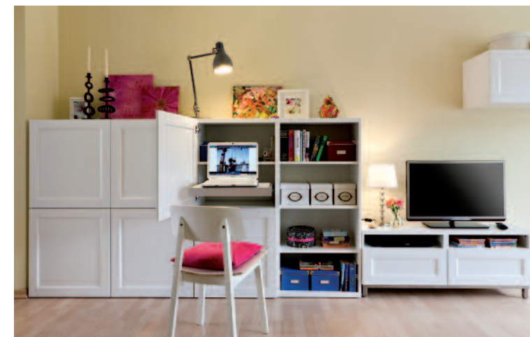
Kompakt Die halbhohe Schrankwand aus „Bestå“-Elementen (Ikea) beherbergt sogar Arbeitsplatz und Fernseher. Für Gästekleidung werden Fächer frei geräumt.