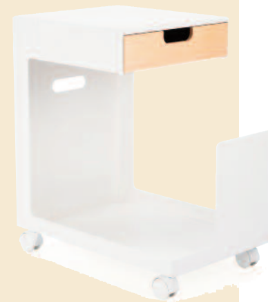
Vielseitig begabt „Lesezeichen“, Schublade, Rollen – „Ed“ hat viele Vorzüge, ca. 330 Euro (Connox).

Damit Ihre Gäste Licht, Buch und Wecker in Reichweite haben, benötigen sie einen Nachttisch. Hier eignen sich kleine Beistelltische oder Rollcontainer, die sonst eine andere Funktion haben, sich aber leicht ans Gästebett bewegen lassen.