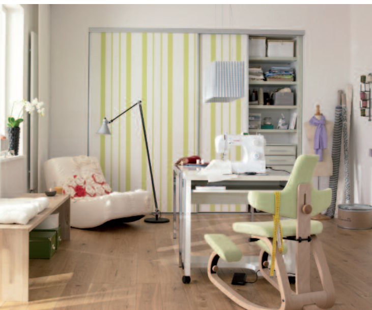
Großgarage für Hobby & Co Im Einbauschranks (Cabinet) hat alles Platz, was in diesem Schneideratelier benötigt wird. Sogar der Nähstisch kann hinter den dekorativ gestalteten Schiebetüren geparkt werden, dann entsteht eine große Freifläche fürs Gästebett.