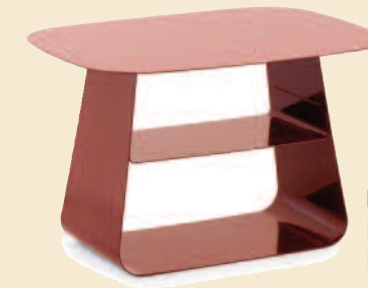
Multitalent Beistelltisch „Stay“ macht sich auch gut am Bett, ca. 195 Euro (Norman Copenhagen).