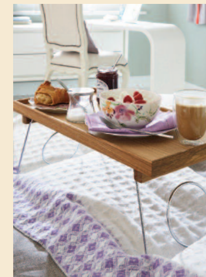
Roomservice Ein Konsoltisch mit Tablett ist nachts Ablage und serviert morgens das Frühstück ans Bett, ca. 160 Euro (Car).

Gästezimmer sind meist nicht nur dem Übernachtungsbesuch vorbehalten. Sie werden zusätzlich als Hobbyraum, Büro oder zur Aufbewahrung genutzt. Schrankraum mit variabler Aufteilung ist in diesem Fall ideal, ob hinter Schiebetüren oder Vorhängen.