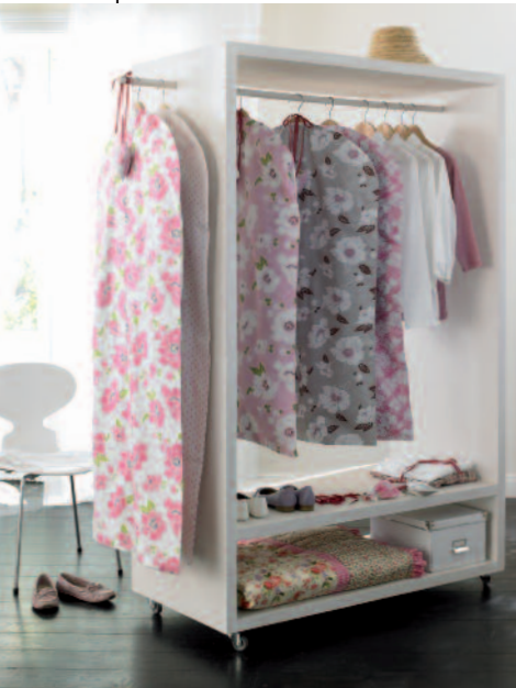
Mobiler schrank Kleidersäcke bieten in der offenen Garderobe Privatsphäre, ca. 285 Euro (Car).