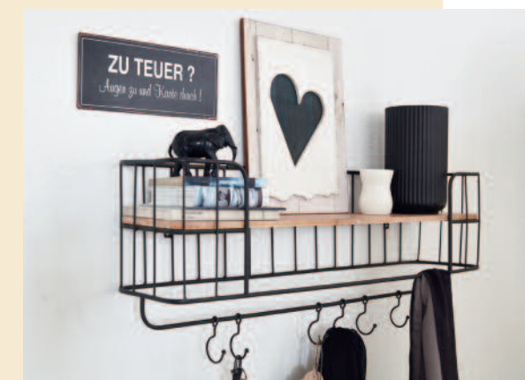
Two in one Ein Wandregal mit Haken bietet Abstellfläche und Aufhängemöglichkeiten für Kleidung zugleich, ca. 60 Euro (Impressionen).