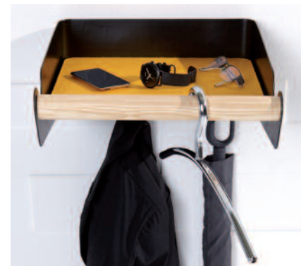
Empfänglich Für Kleinkram und Kleider: „Urban Wardrobe“, ca. 200 Euro (Müller Möbelwerkstätten).