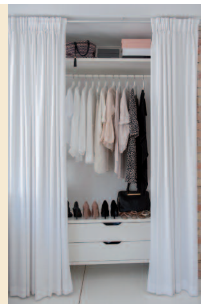
Vorhang auf für pfiffigen Stauraum Das flexible System „Stolmen“ (Ikea) eignet sich für die Saisongarderobe. Ein Vorhang schützt vor Staub. Kommen Gäste, werden die eigenen Sachen beiseitegeschoben.