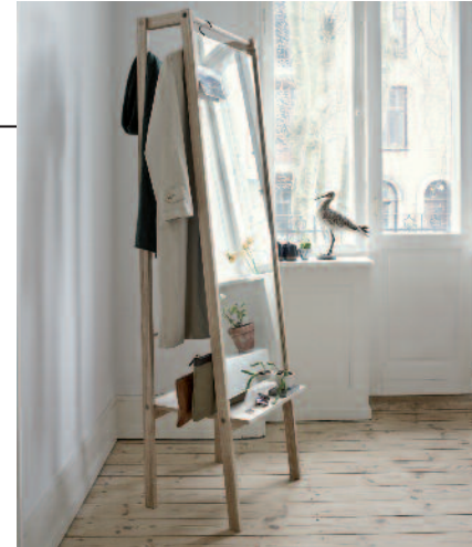
Braucht wenig Platz Spiegel, Ablage und Garderobe ist das schicke Eichenmöbel „Push“, ca. 650 Euro (Skagerak).