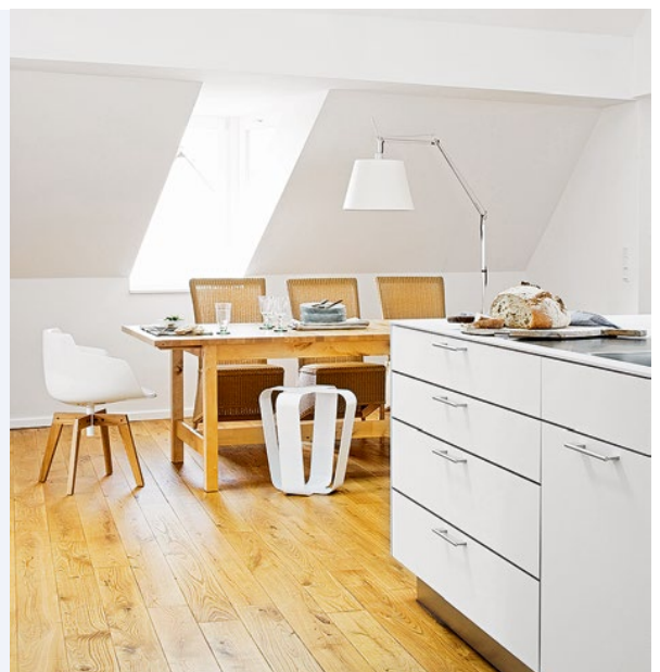
Die Dachschräge bei der Raumaufteilung berücksichtigen Stellen Sie in der Wohnküche den Esstisch unter die Schräge. So bleiben die geraden Wände für die Küchenmöbel frei.

Viele Oberschränke Bis in die Spitze nutzen geschlossene und offene Elemente die dreieckige Wandfläche. Schrankelement „Metod“ ab ca. 30 Euro (Ikea).