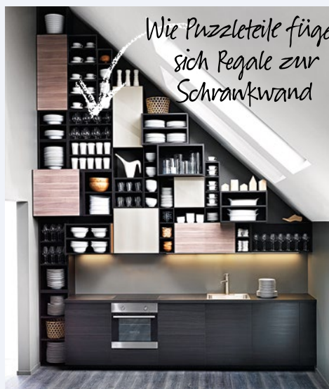
Wie Puzzleteile fügen sich Regale zur Schrankwand

Die Herausforderung ist, hier genügend Stauraum zu schaffen. Haben Sie Mut, zu improvisieren und denken Sie bei der Platzierung der Möbel ruhig um die Ecke.