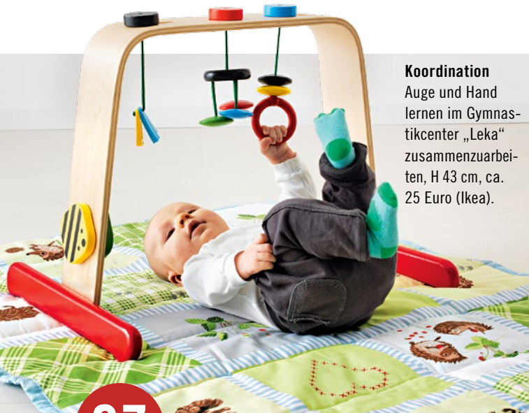
Koordination Auge und Hand lernen im Gymnastikcenter „Leka“ zusammenzuarbeiten, H 43 cm, ca. 25 Euro (Ikea).