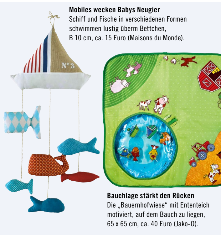
Mobiles wecken Babys Neugier Schiff und Fische in verschiedenen Formen schwimmen lustig überm Bettchen, B 10 cm, ca. 15 Euro (Maisons du Monde).

Die Sinne schärfen und erste Bewegungsabläufe trainieren – dafür gibt es hübsche und gut durchdachte Greif- und Motivationsspiele sowie Mobiles für die Aller kleinsten.